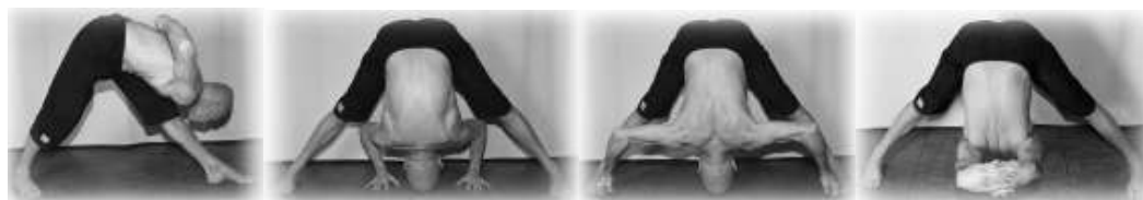
Parsvottanasana Prasara Padottanasana I – II – III