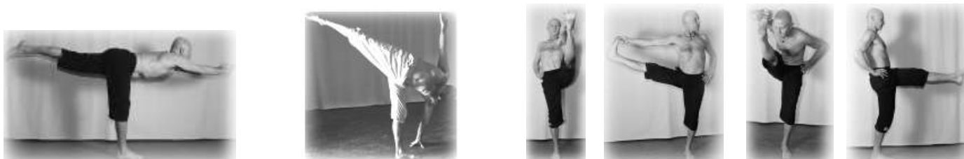
Virabhadrasana III Ardha Chandrasana Utthita Hasta Padangusthasana