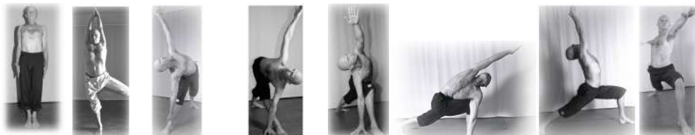
Tadasana Vrkasana Utthita Trikonasana Parivrtta Trikonasana Parsvakonasana Parivrtta Parsvakonasana Virabhadrasana I et II

Durant la pratique, protéger la respiration naturelle et la détente du visage