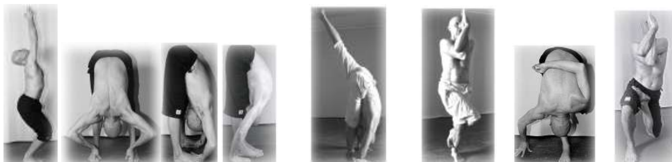
Utkatasana Padangusthasana Padahasthasana Uttanasana Urdhva Prasara Ekapadasana Garudasana Ardha Pada Padmottanasana Vatsyasa